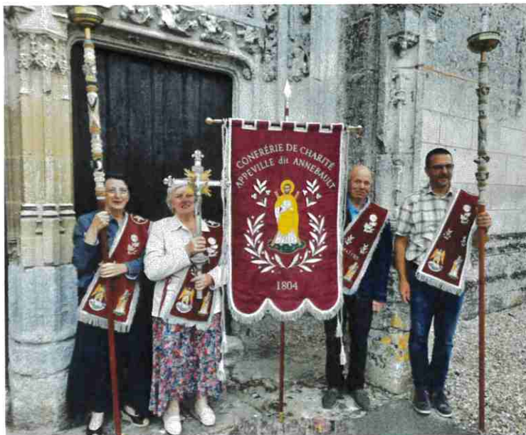
Juillet 2024- Chatirons en grande tenue avec la bannière

Confrérie de Charité d'Appeville dit Annebault